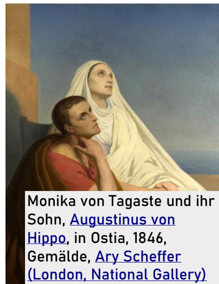
Monika von Tagaste und ihr Sohn, Augustinus von Hippo , in Ostia, 1846, Gemälde, Ary Scheffer ( London, National Gallery )

Eine andere Mutter feiern wir in den nächsten Wochen: die hl. Monika. Sie hatte es in ihrem Leben nicht leicht, aber der Glaube war ihre Stärke und hat ihr geholfen trotz aller Aussichtslosigkeit um die Bekehrung ihres Sohnes zu beten und zu vertrauen, dass ihr Gebet nicht ins Leere gehen wird. Mütter haben eine sehr große Aufgabe, die weit mehr ist, als wir es heute „verkündet“ hören. Es ist immer eine Schande, dass noch nie der Staat die „Arbeit“ der Mütter anerkennt, eine Arbeit die sonst niemand leisten kann – keine Kitas, keine Psychologen usw. Die heilige Monika zeigt uns, was Kinder am meisten brauchen und was ihnen schließlich Halt im Leben gibt und auch die Kraft gibt, sich von Irrwegen abzuwenden und ein neues Leben zu wagen. Mögen die Mutter Gottes und die Hl. Monika – wie auch viele andere Heilige – uns mit ihren Fürbitten begleiten und helfen, nicht nur selber dem Weg des Lebens zu folgen, sondern auch anderen und besonders unseren Kindern zu helfen, hellhörig zu werden und die Frohe und Befreiende Botschaft der Liebe Gottes für uns von den vielen anderen Botschaften zu unterscheiden und ihr mit Freude und Dank zu folgen.